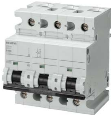
линейный автомат защиты 400 В 10 кА, 3-пол., С, 100 А, Г = 70 мм