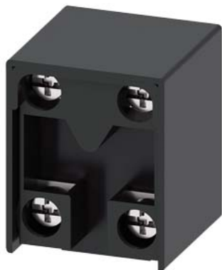
Контактный блок для позиционного выключателя 3SE51/52 1 NO/1 NC, контакт зависимого действия