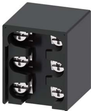
Контактный блок для позиционного выключателя 3SE51/52 1 NO/2 NC, контакт зависимого действия