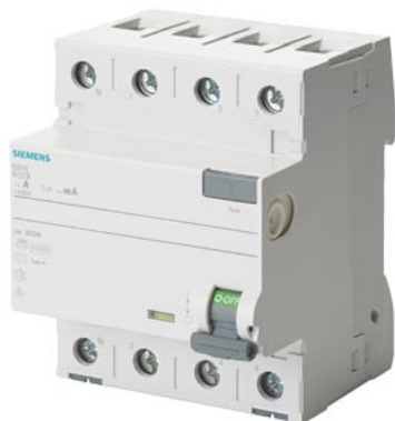
УДТ, 4-пол., тип А, In: 40 А, 30 мА, Un AC: 400 В, N слева