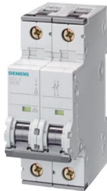
линейный автомат защиты 400 В 10 кА, 2-пол., D, 4 А, Г = 70 мм