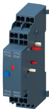
Сигнальный контакт для автоматического выключателя 3RV2 с подключением на пружинных клеммах