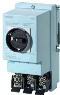
ET 200pro RSM Модуль ремонтных выключателей до 25 А до 25 А Функция разъединения для Главная цепь Nap Q4/2