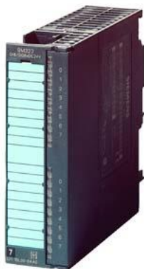
SIMATIC S7-300, Digital module SM 323, isolated, 16 DI and 16 DO, 24 V DC, 0.5 A, Total current 4A, 1x 40-pole