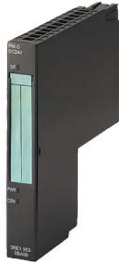
PM-D для ET 200S Силовой модуль для пускателя 24 В DC